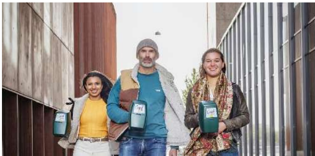
Als de collectant aan je deur staat, geef dan ruimhartig!

Van 8 tot en met 14 maart 2026 vindt de jaarlijkse collecteweek van Amnesty International plaats.